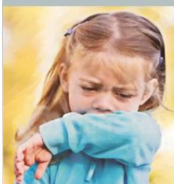
kichanie w zgięcie łokcia