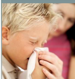
kichanie w chusteczkę